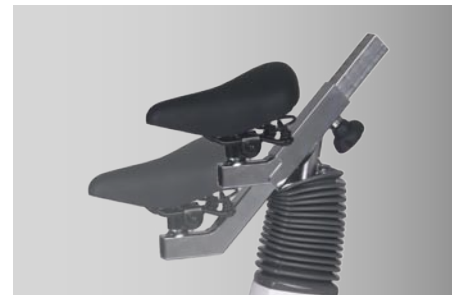
Sattelverstellung für Kinder-Ergometrie