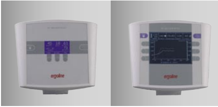
Unterschiedliche Bedien-Einheiten (P und K)